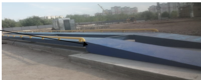
Рисунок 2 - Место нанесения знака утверждения типа на боковую сторону ГПУ весов

Общий вид применяемых индикаторов представлен на рисунке 3.